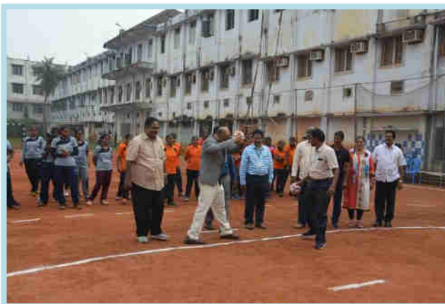
Delegates inaugurating the Tournament