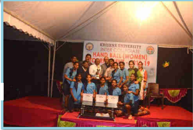
Championship to KBN College